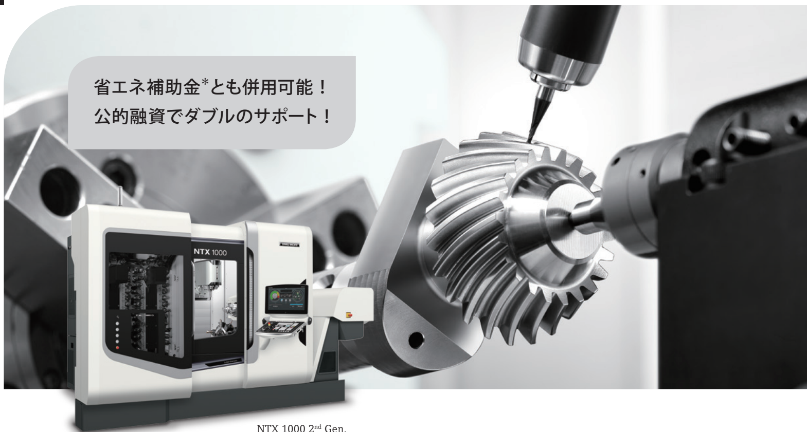
NTX 1000 2 nd Gen.