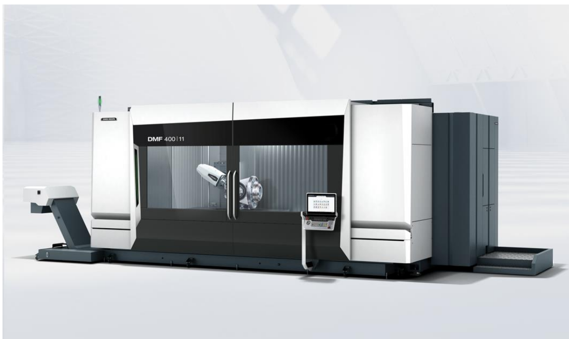
世界初公開 DMF 400|11