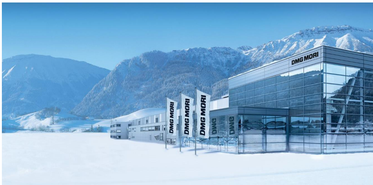
フロンテン工場外観