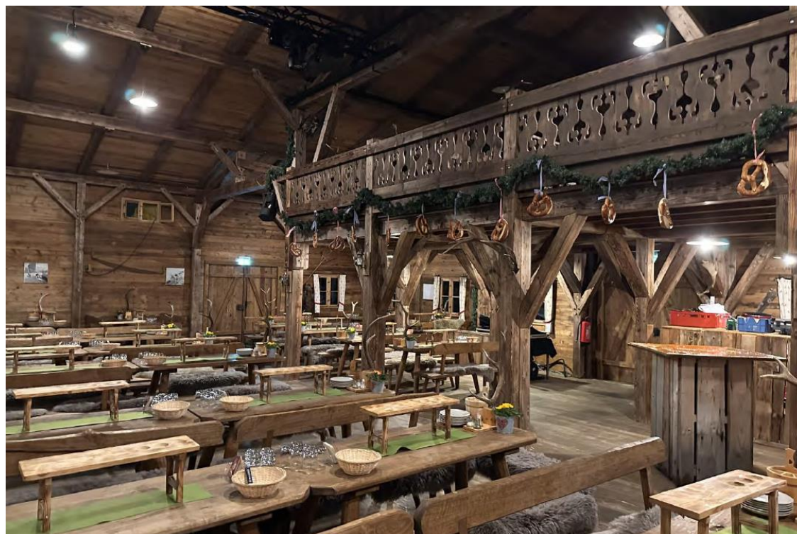
施設内のレストラン