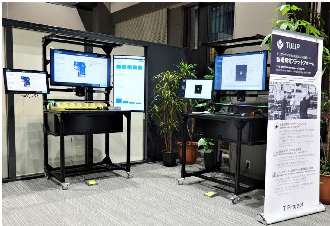
TULIP エクスペリエンスセンタ名古屋 ワークベンチ

TULIP エクスペリエンスセンタ(以下、TEC)は、東京都江東区の T Project オフィス併設の「TEC 東京」が 2022 年 8 月に開所しており、TEC 名古屋は国内 2 番目となります。TEC 名古屋のある DMG 森精機セールスアンドサービス株式会社 本社は名古屋駅至近で、中部・関西圏の企業・パートナーにとってアクセスしやすい立地です。TEC 名古屋では TULIP を導入したワークベンチを 2 台設置しており、最新技術を用いたデバイス連携を体験できるデモや、活用動画の視聴を行えます。