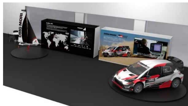
スポーツマーケティングエリア