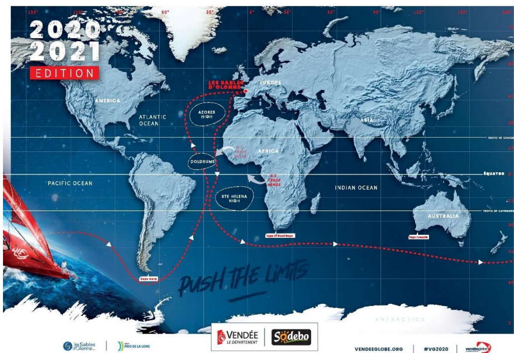
Vendée Globe 2020-2021 ルート