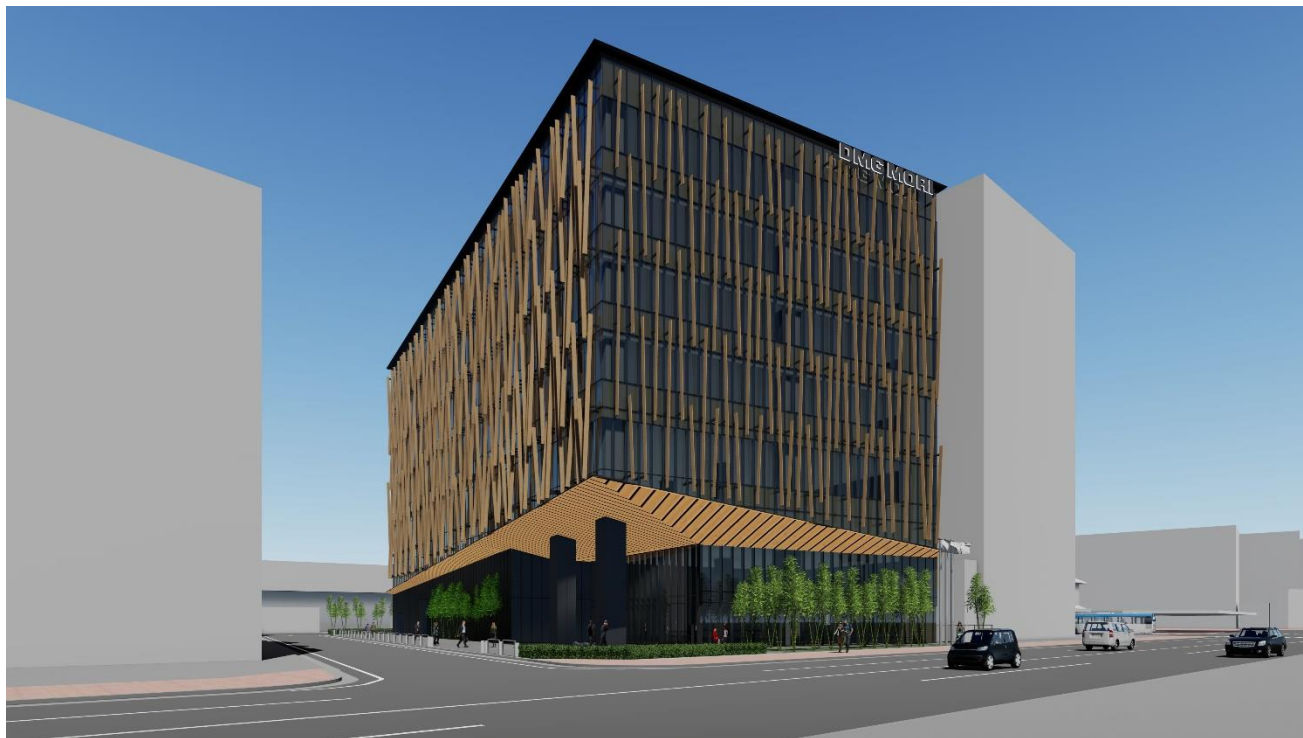
奈良商品開発センタ 外観