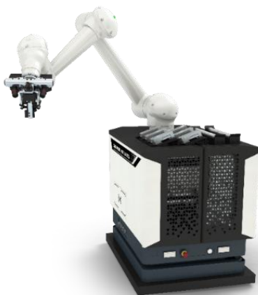
自律走行型ロボット WH-AGV 5