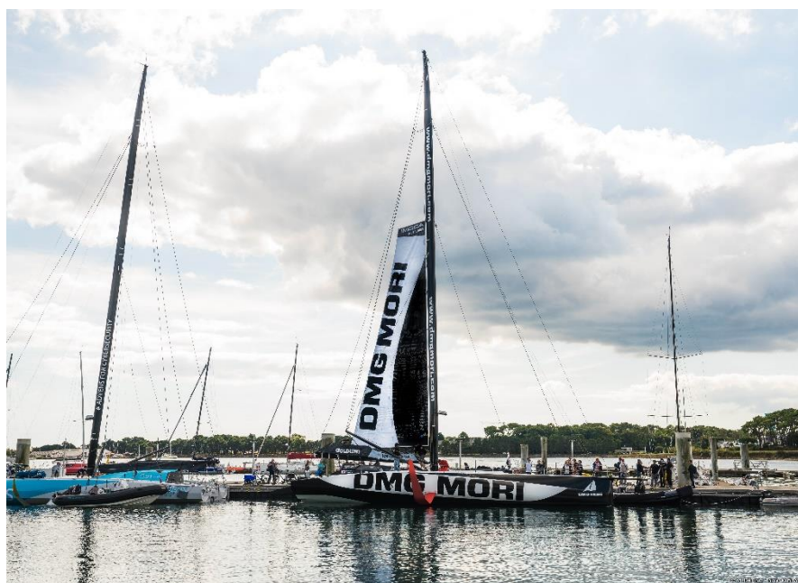
DMG MORI Global One 号

新艇は、昨年12月よりフランス・ヴァンヌの Multiplast 社にて建造を開始し、約10か月をかけて完成を迎えました。チームは今後、2020年11月に開催される単独・無寄港・無補給の世界一周ヨットレース「Vendée Globe 2020」への出場権獲得に向け、まずは、フランスやポルトガルにてトレーニングを積み重ねます。その後、2020年5月に大西洋横断ヨットレース「The Transat」や、「Transat NY-Vendée」等の Vendée Globe2020 予選レースへの出場を予定しています。