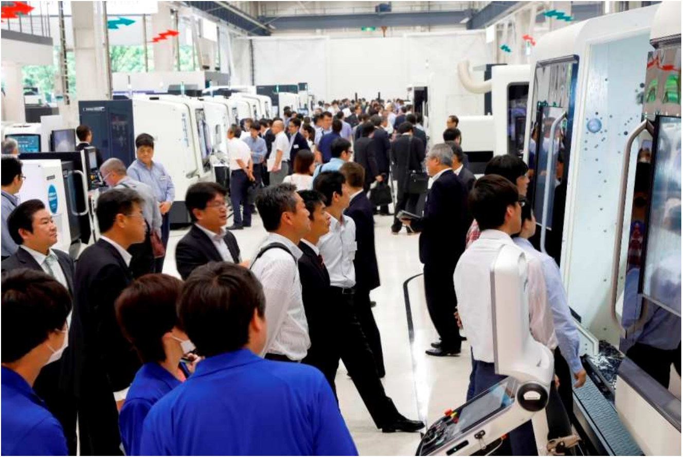
写真 1. 展示会場