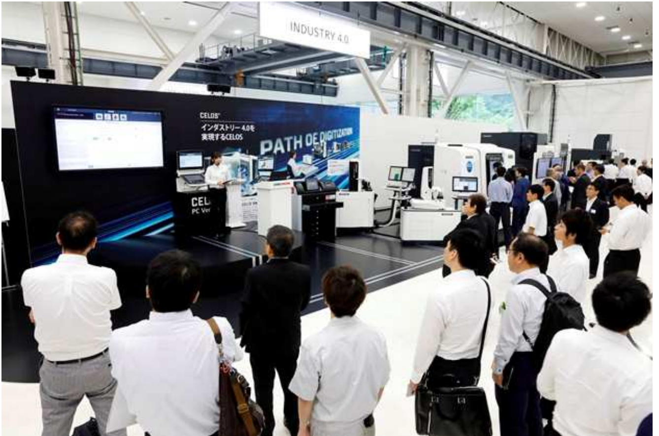
写真 3. Industry 4.0/コネクティッドインダストリーズ