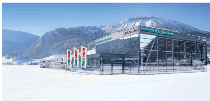
フロンテン工場外観

⇒ http://www.dmgmori.com/webspecial/pfronten_2017/jp-JP/information.htm