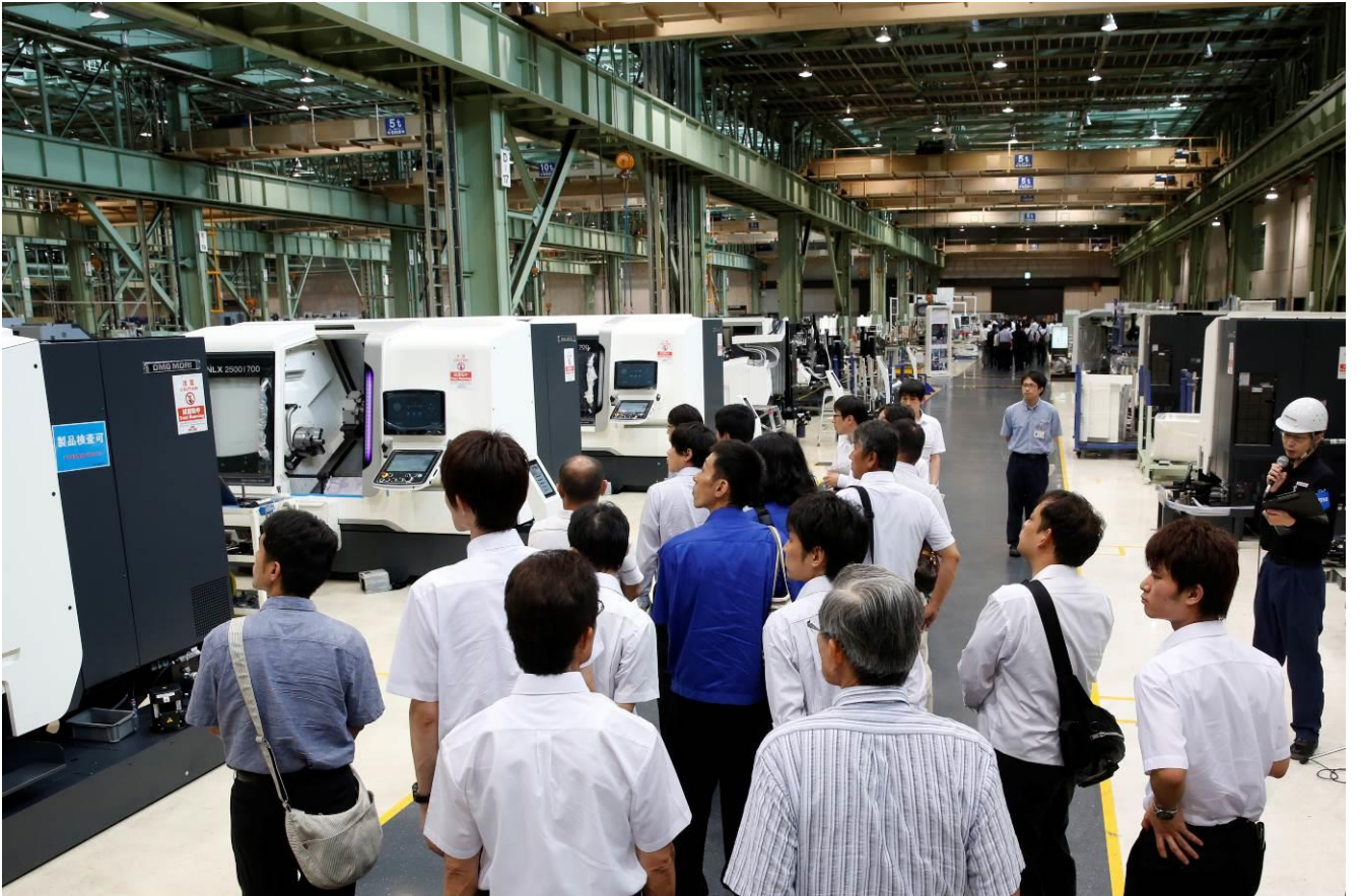
写真 5. 工場見学会