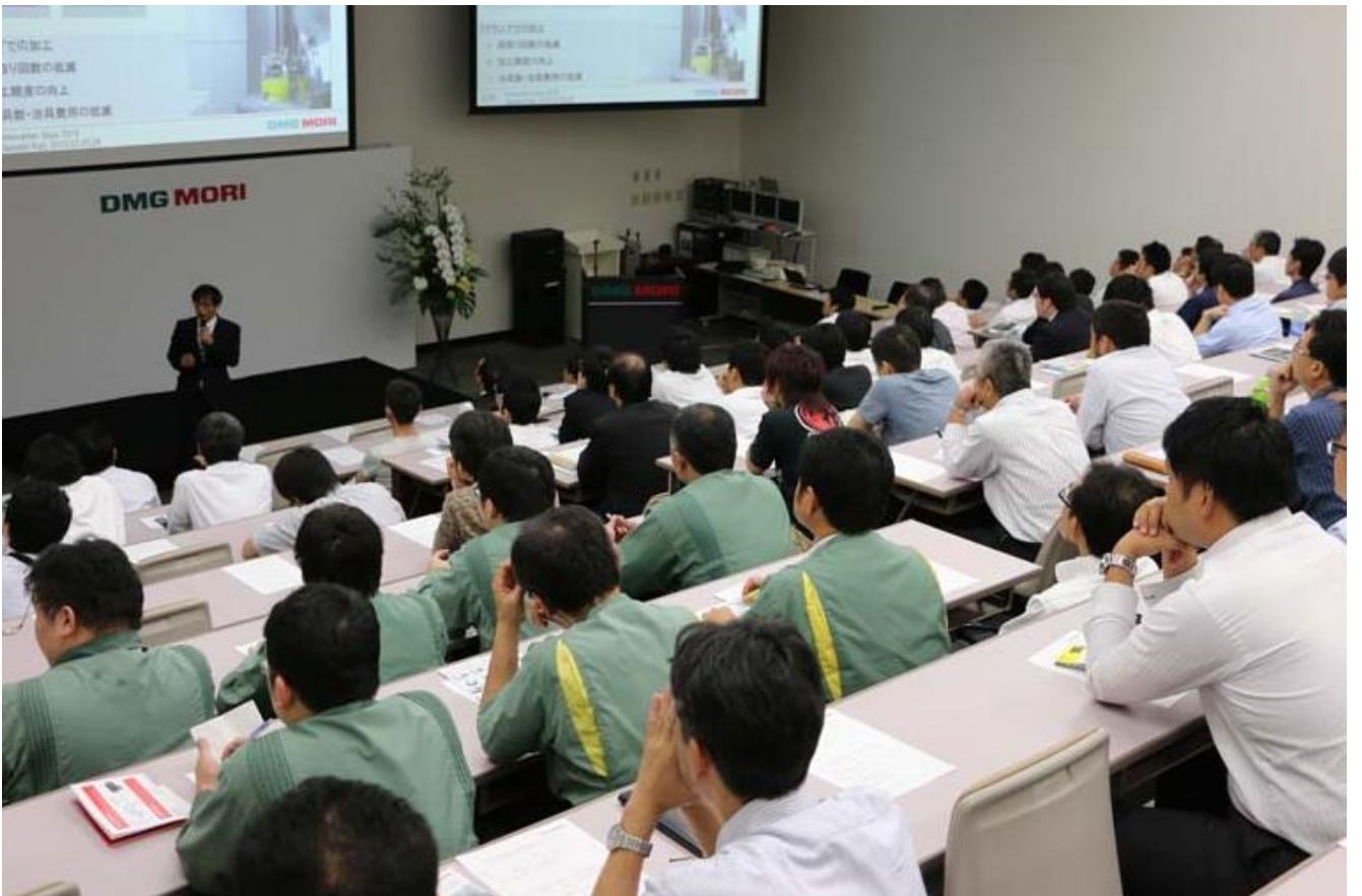
写真 6. セミナー風景