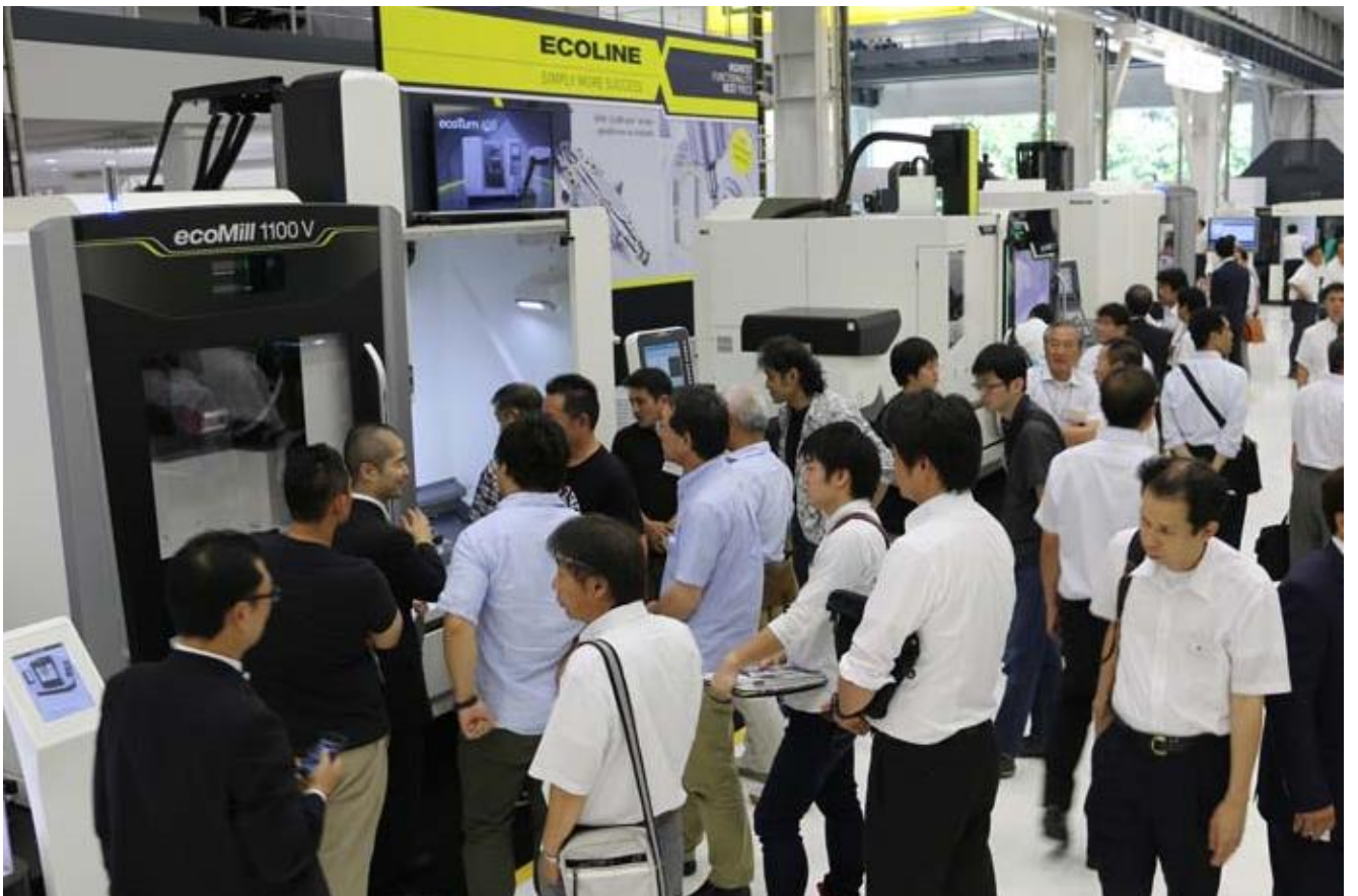
写真 4. ecoMill V シリーズ