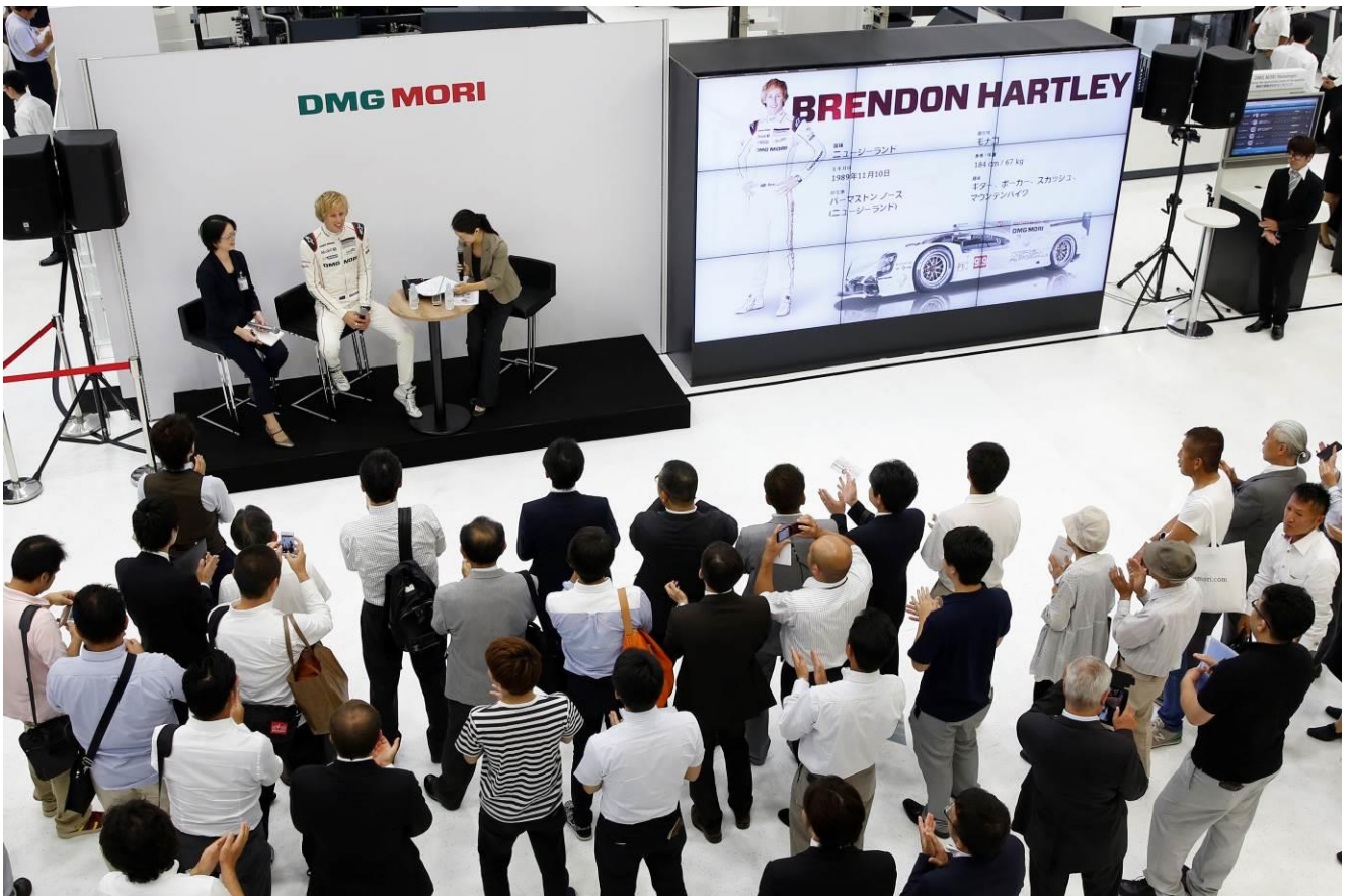
写真 2. ポルシェ スペシャルイベント