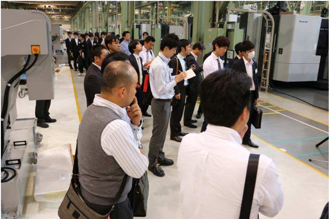
写真 5. 工場見学会