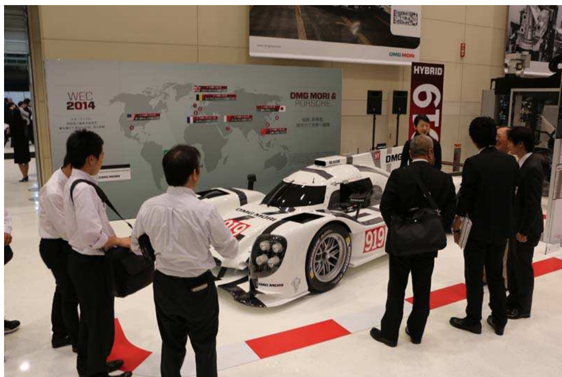
写真 4. ポルシェ 919 ハイブリッド