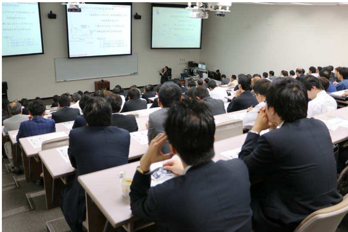
写真 6. セミナー風景