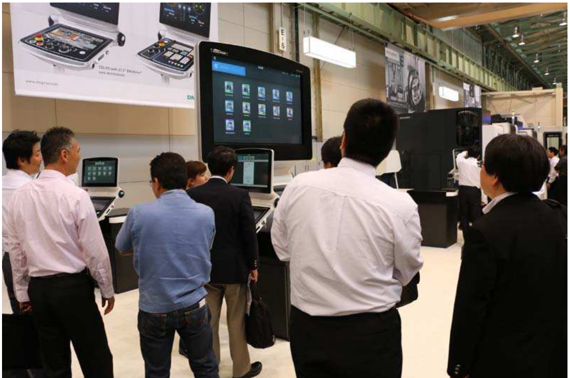
写真 2. BIG CELOS