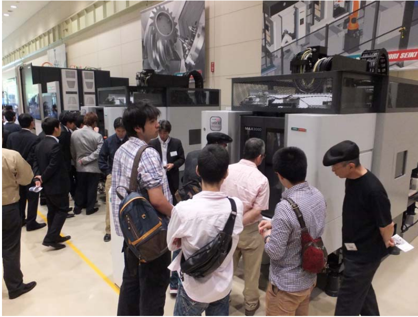
写真 3. MAX3000