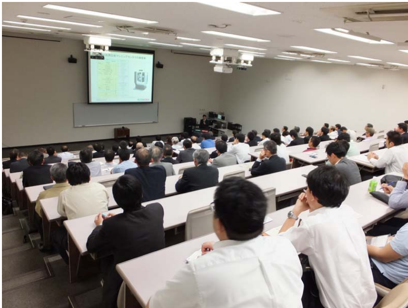
写真 6. セミナー風景