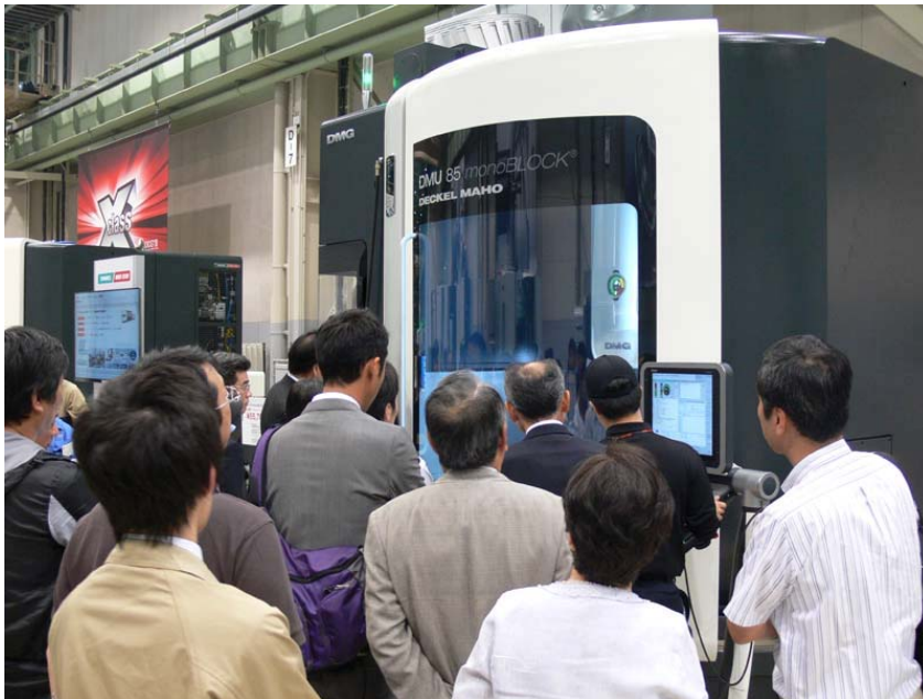
写真 4. DMU 85 monoBLOCK®