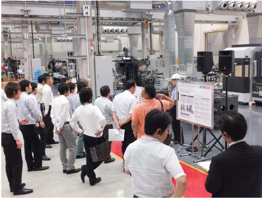
写真 5. 工場見学会