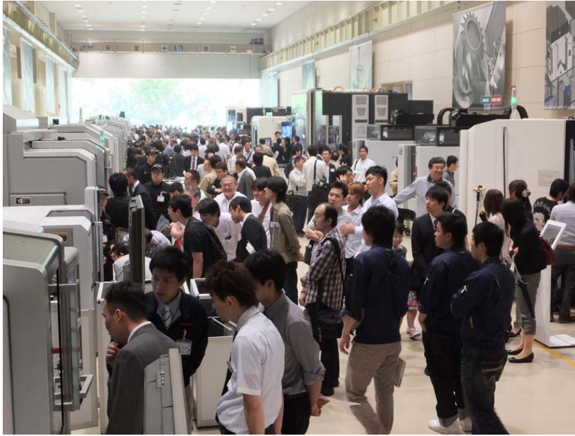
写真 1. 展示会場風景