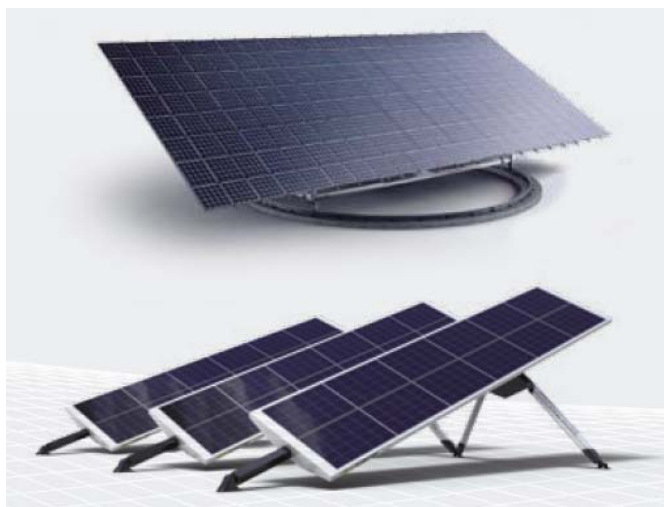
太陽光発電設備 SunCarrier250(上)と SunCarrier22(下)

Gildemeister 社は自家消費のための再生可能エネルギー発電のリーディングカンパニーです。今回の設備導入に先立って、ビーレフェルト工場では総合的なエネルギー効率分析とエネルギー消費の最適化を行いました。大量の電力を消費する企業は、再生可能エネルギーの自家消費によって、今日のエネルギー政策の変化に貢献できるというのが Gildemeister 社の考えです。