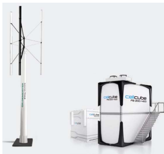
風力発電設備 WindCarrier レドックスフロー電池 CellCube FB 10-100と FB200-400