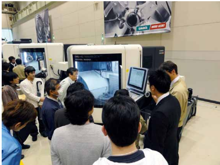
図 2. DMU 40 monoBLOCK ® によるブレード加工