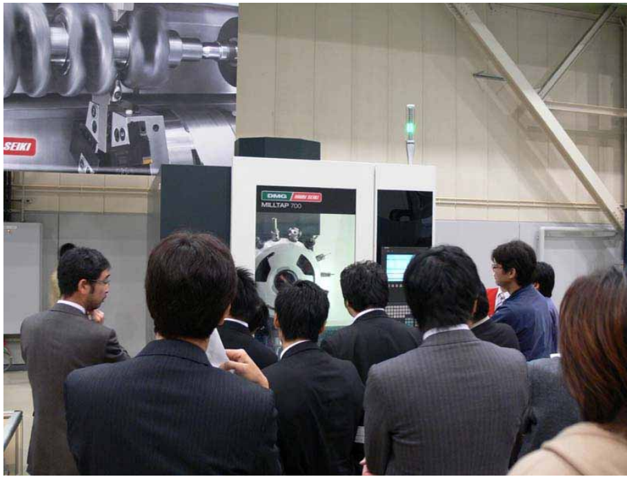
図 3. MILLTAP 700