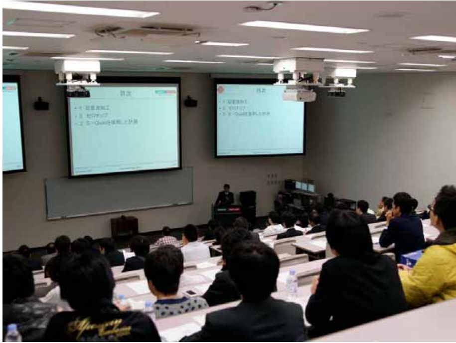
図 5. セミナー風景