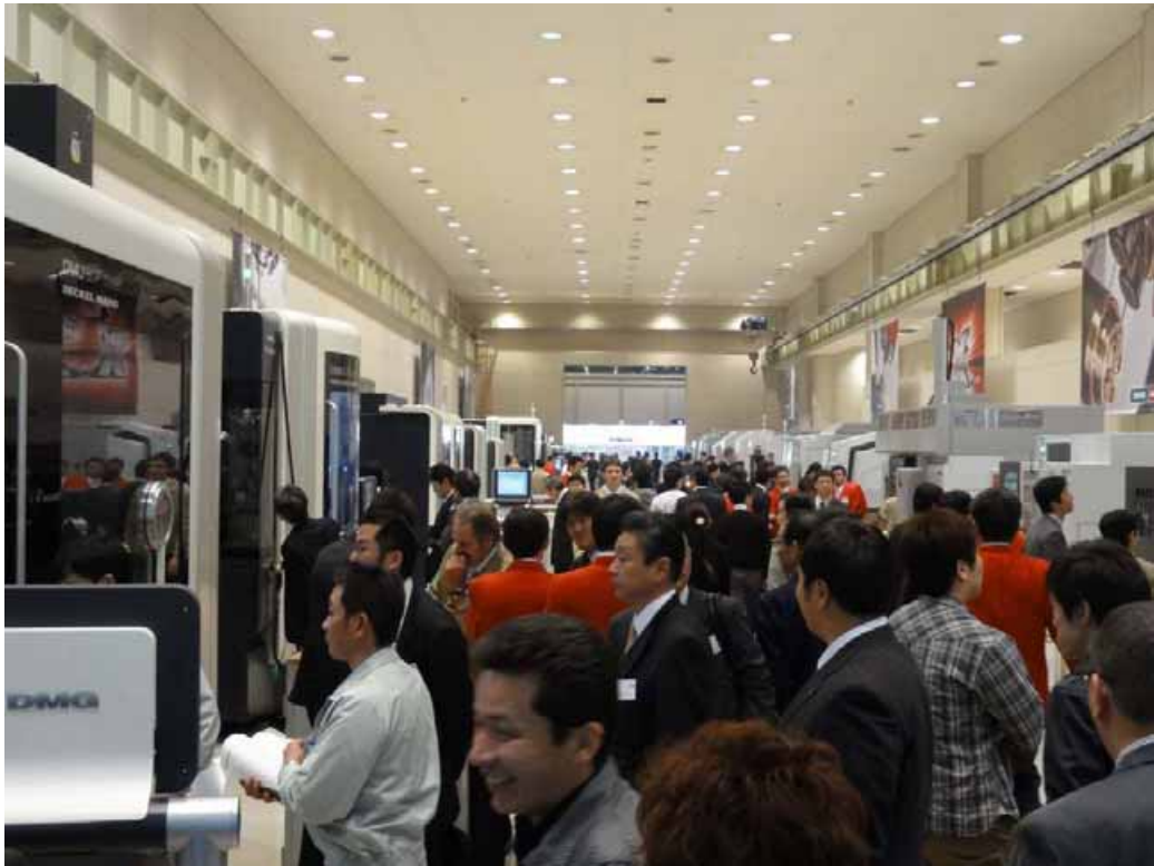
図 1. 展示会場風景