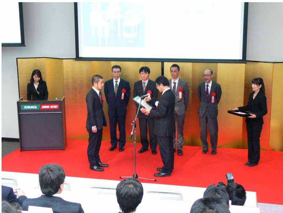
図 4. ドリームコンテスト表彰式