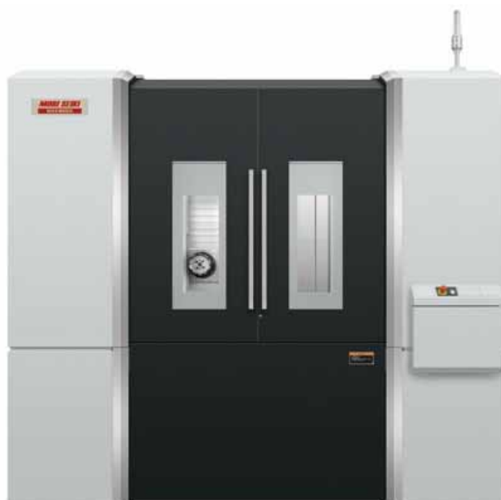
図 1. 外観