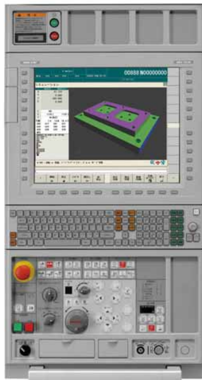
図 3. MAPPS IV 操作盤