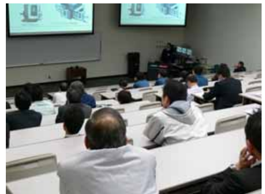
図 2. セミナー