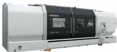
図 1. NZL6000