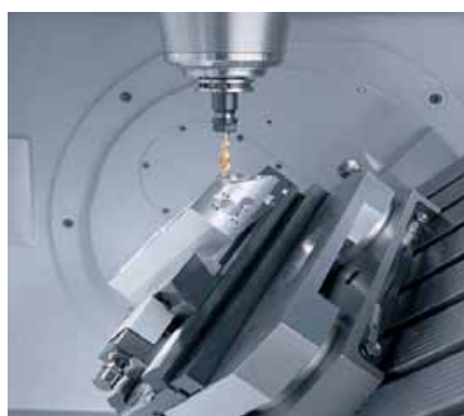
図 3. 5 軸加工事例