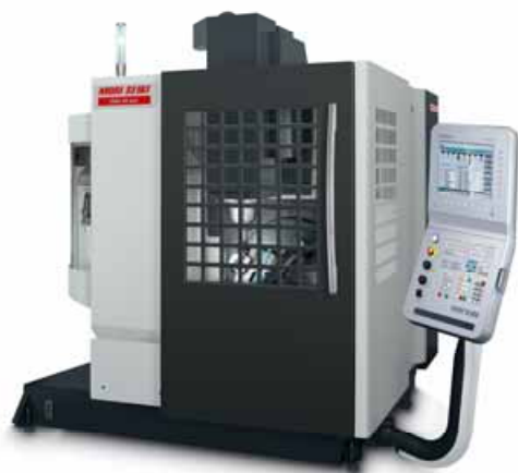
図 1. 外観図