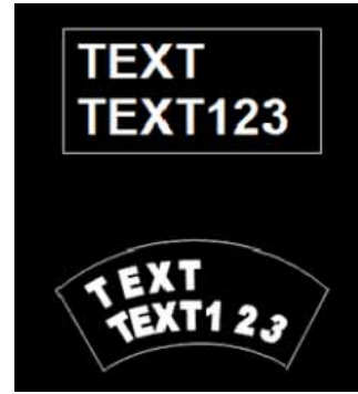
図2. 設定画面例(文字の配置)