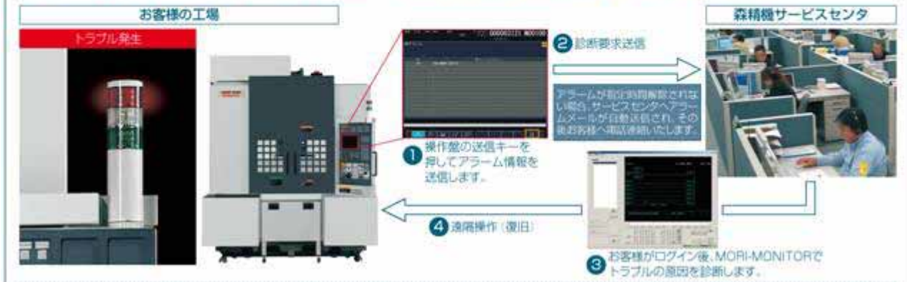
図 1. 遠隔保守サービス

アラーム発生時に、ネットワークを介して送信された診断要求をもとに、サービスセンターがトラブルの原因をスピーディに診断し、復旧に向けて迅速に対応します。