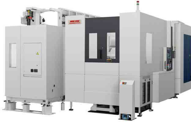
图 1: 外觀