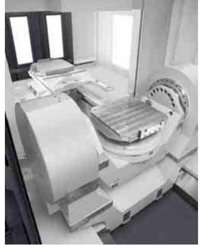
图 2: 機内